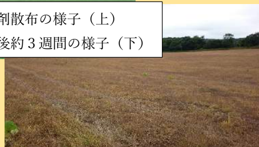
散布後約 3 週間の様子 (下)