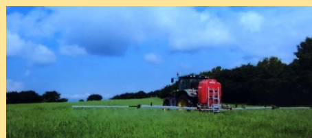
除草剤散布の様子 (上) 散布後約 10 日後の様子 (下)