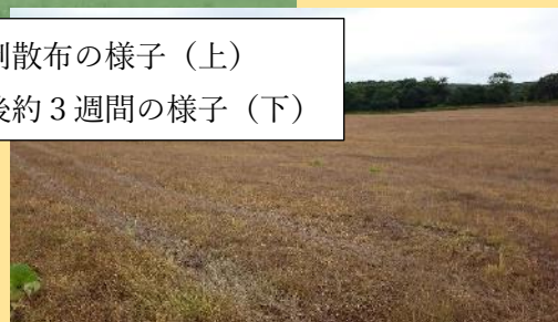
散布後約3週間の様子 (下)