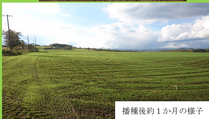
播種後約 1 か月の様子

今年度は 9 月に上陸した台風の影響もあり、土壌や種子の流亡が懸念されます。なお、標記事業に関するお問い合わせは下記までお願い致します。