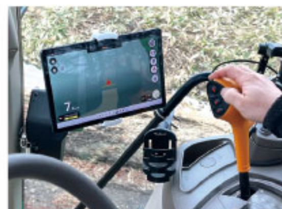
写真3 ガイダンスシステム