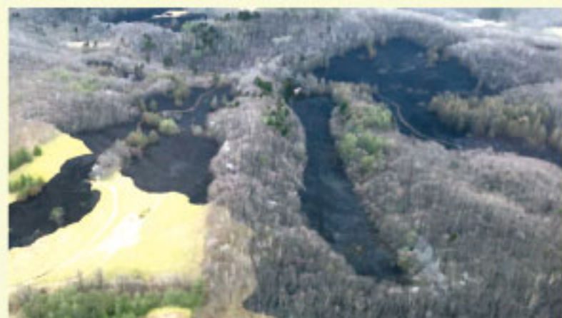
令和2年 阿歴内林野火災の写真

また、タバコやたき火などの小さな火が枯草などに燃え移り大きな火災につながる危険性もありますので、山菜採りなどで入山する際は火の取扱いに十分注意しましょう。