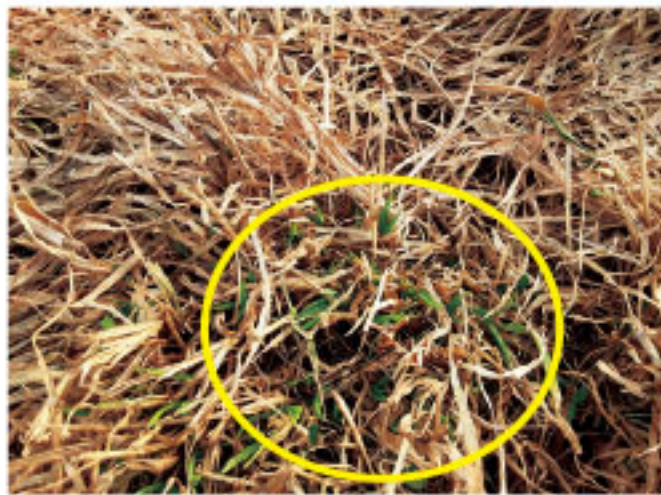
写真1 萌芽したチモシー

チモシーは平均気温が5℃になると、萌芽を開始します。萌芽期の草地では、遠目から見ると枯れているように見えますが、近くで見ると新しい茎葉が出ているのが分かります(写真1)。