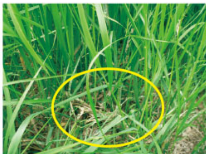
写真2 牧草に付着したスラリー

春にスラリーを散布する場合、できるだけ早い時期に行う必要があります。施肥効果を高める狙いもありますが、散布が遅くなると、草丈が長くなり、牧草に付着が多くなります(写真2)。牧草に付着したまま収穫を行うと、サイレージの発酵品質低下を引き起こすだけでなく、糞尿が牛の口に入る可能性もあります。そのため、目安として、5月上旬までに散布を終えるよう計画的に作業を進めましょう。