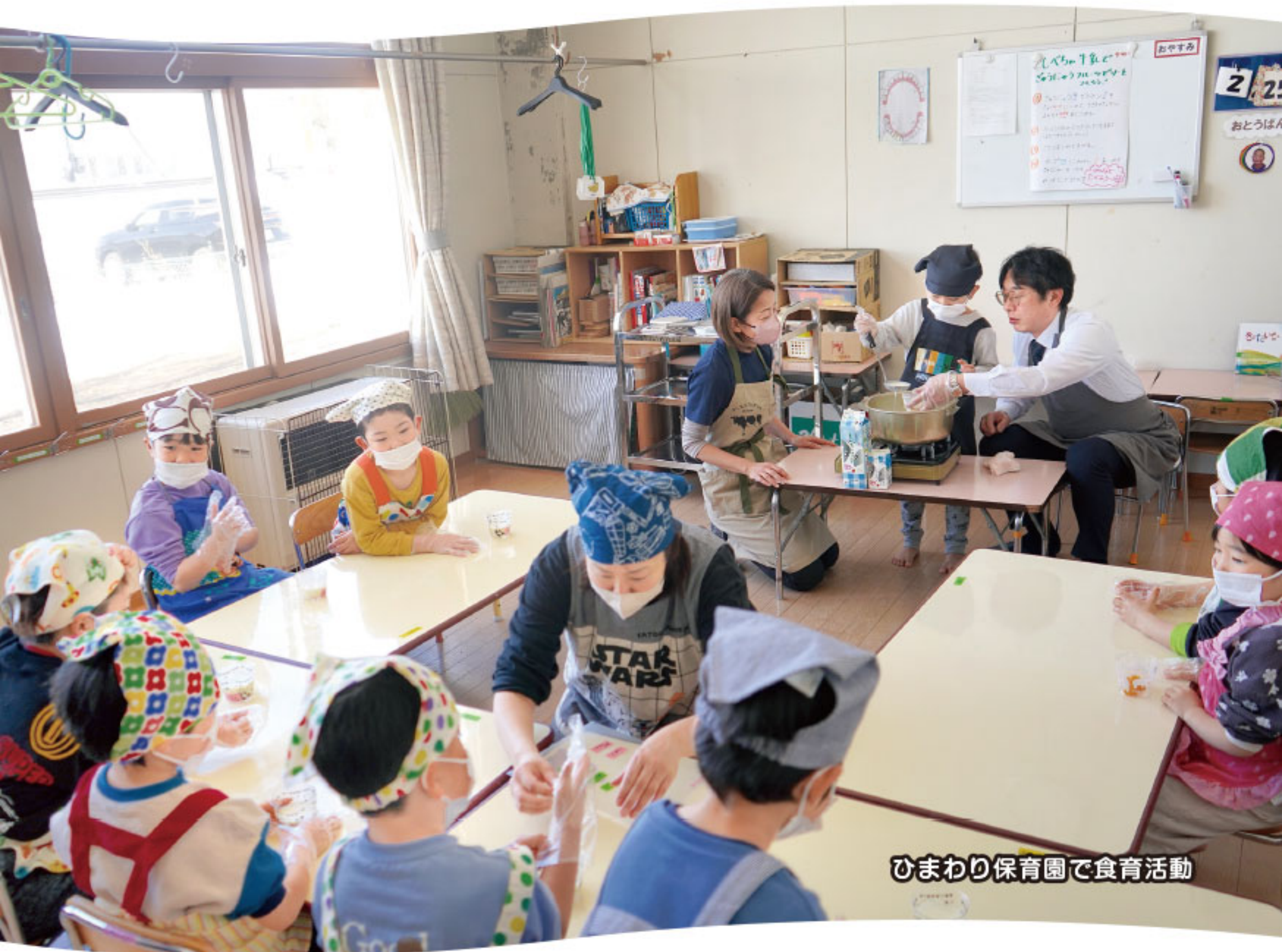
ひまわり保育園で食育活動