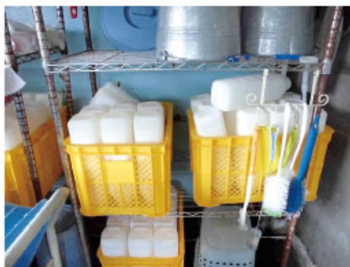
写真1 乾燥棚でしっかり水切り

長く使用したボトルには、細かい傷の中にミルクの洗い残しが蓄積します。搾乳機器と同じようにアルカリ洗剤で洗浄し、乾燥させることで清潔を保てます(写真1)。汚れのひどいものは思い切って新品に更新しましょう。