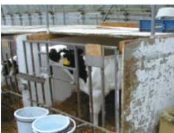
写真2 ハッチ上部に風よけのコンパネ設置

秋は昼夜の寒暖差が大きくなり、牛舎の窓の締め切りも多くなる時期ですが、日中の太陽が出ている時間は窓を開放しましょう。ただし、牛に直接風が(秒速0.3m以上)当てないために、写真2のような風よけの場所を作る、扉や壁からのすきま風を無くすことが必要です。