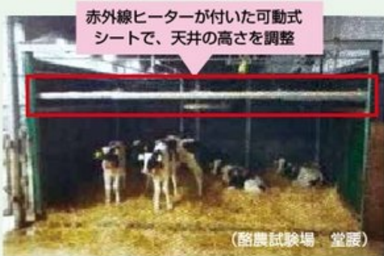
写真① シートを利用した保湿対策

床に敷く断熱材等を利用する場合は尿溜りができないよう、緩傾斜をつけるか穴開け加工が必要です。天井の高い牛舎等に牛房・分娩房を集積している場合は、ペンの上にベニヤ板等の天板を載せることも保温に有効です(写真①)。