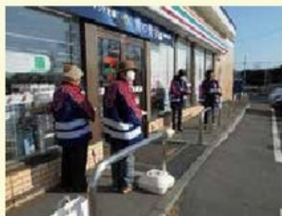
令和元年度に実施された女性防火クラブ 歳末広報の様子

各班新たな課題、問題点、改善がみつきプロジェクトの発展に繋がる報告会になりました。