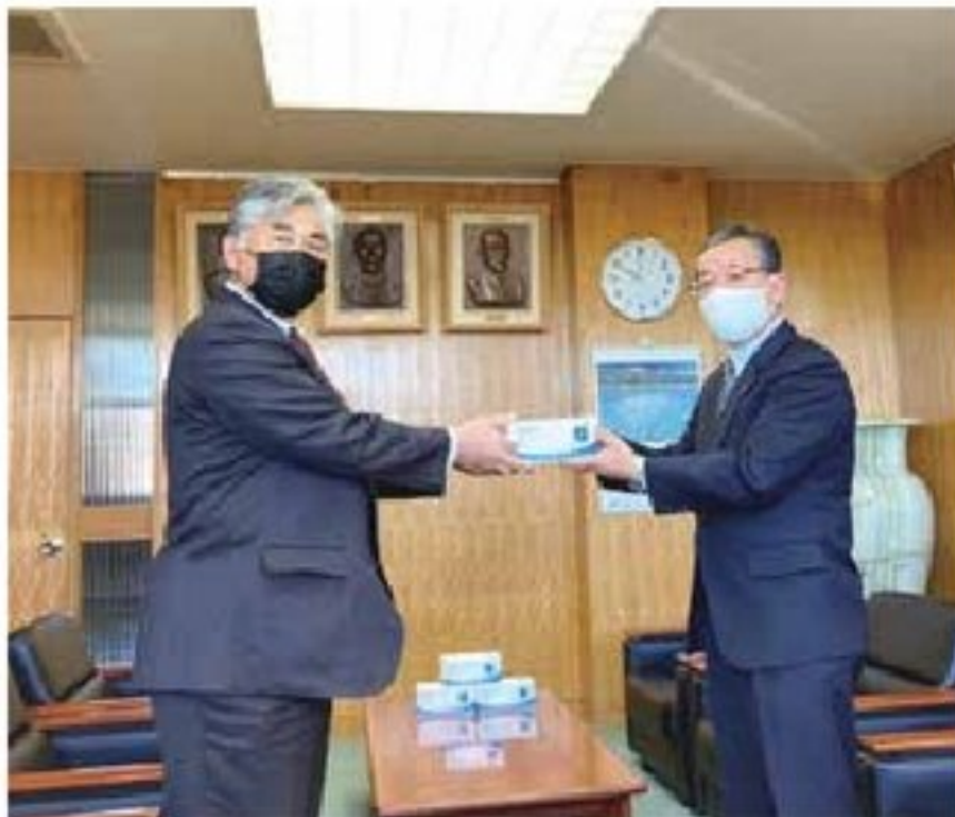
マスク寄贈 標茶町