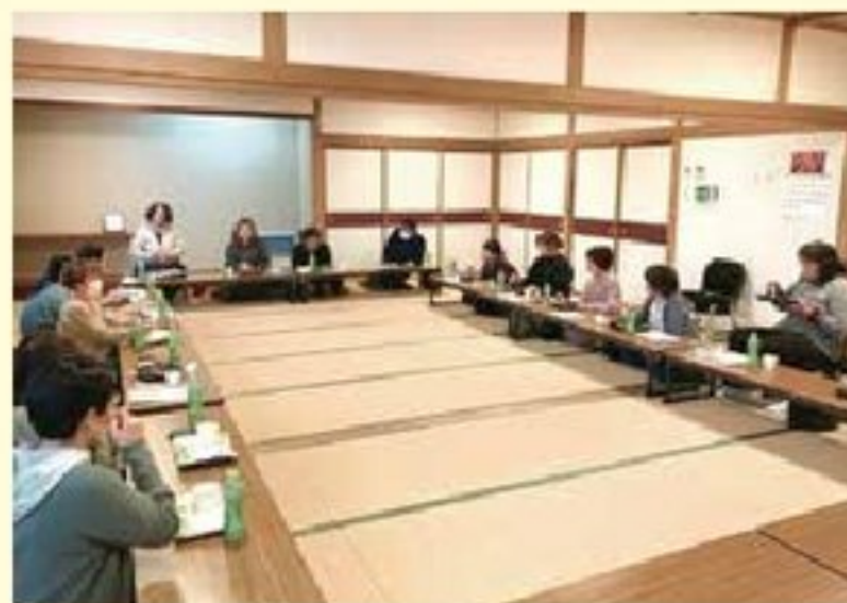
その後の昼食交流会の様子