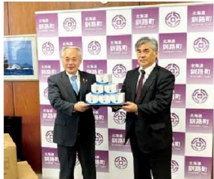
マスク寄贈 釧路町