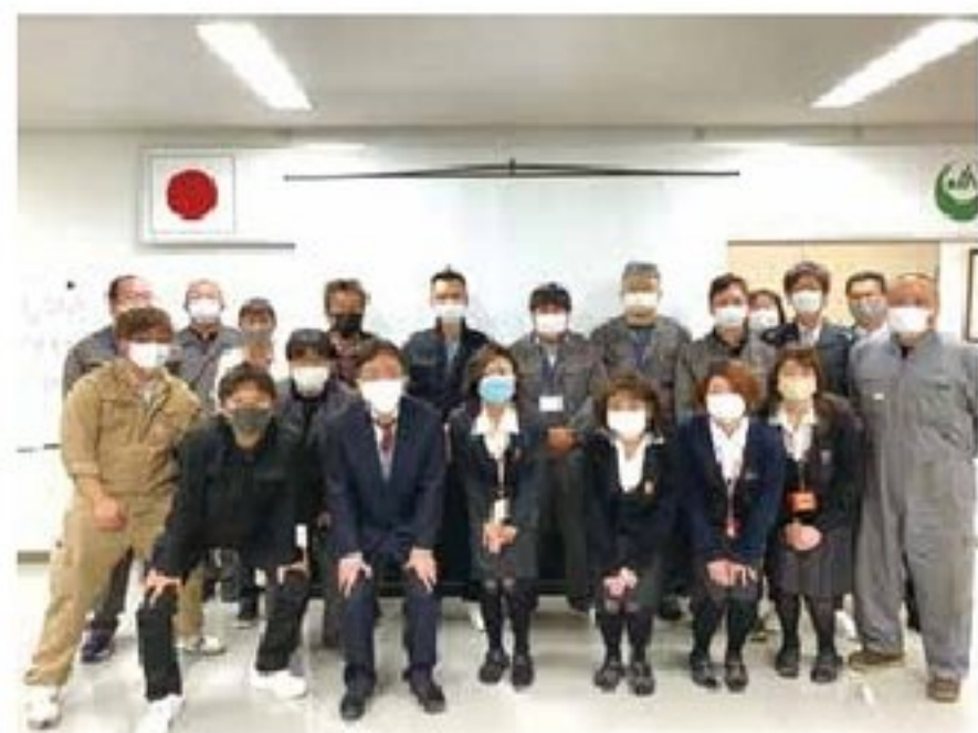
研修終了後、講師の先生を囲んで

「組織ミッションの理解および部門単位の実践プラン作成、働きやすく魅力ある職場の実現へ」