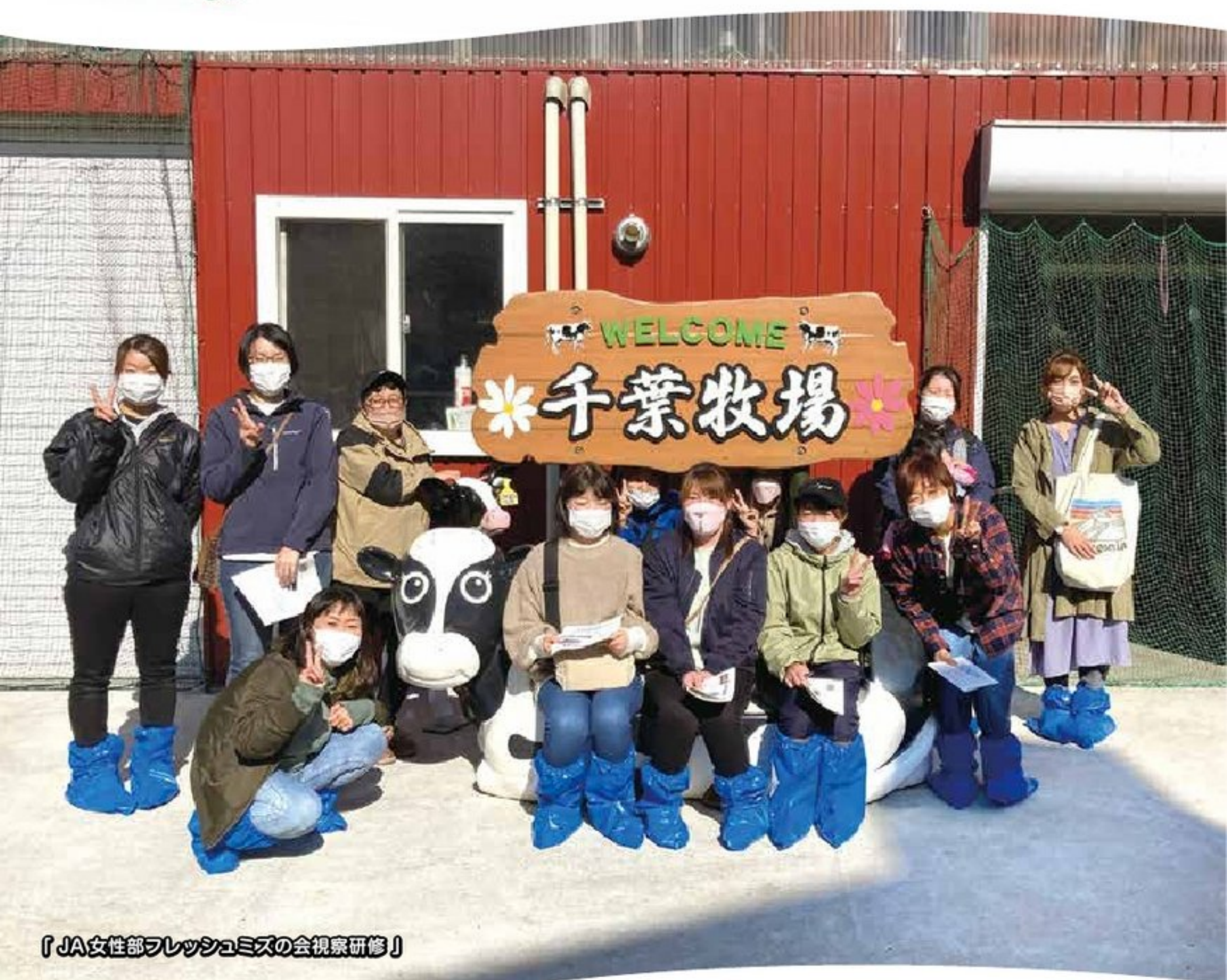
「JA女性部フレッシュミズの会視察研修」