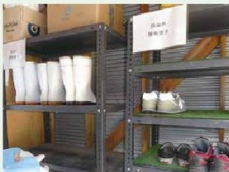
衛生管理区域の出入り口にて靴を履き替える農場