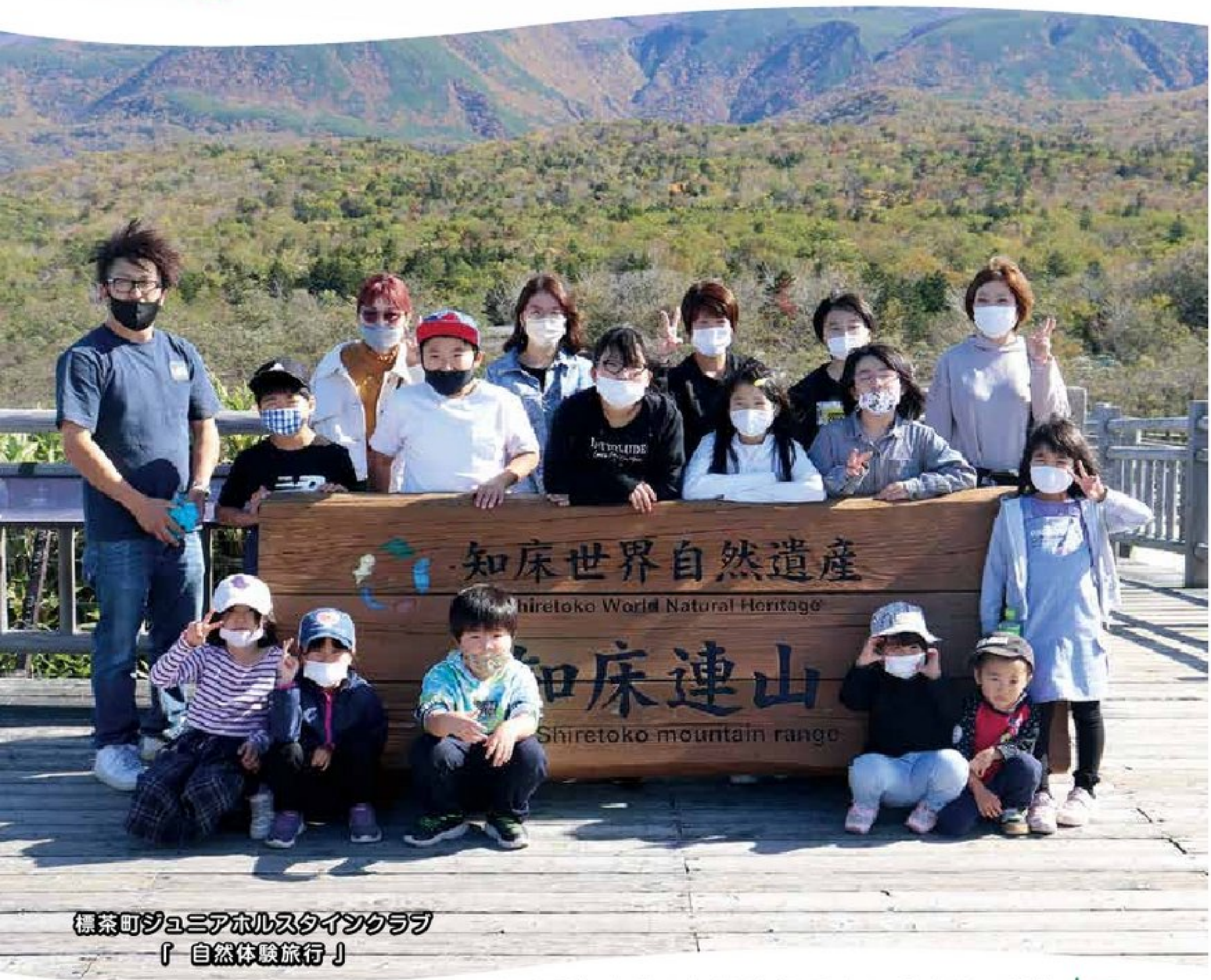
標茶町ジュニアホルスタインクラブ 「自然体験旅行」