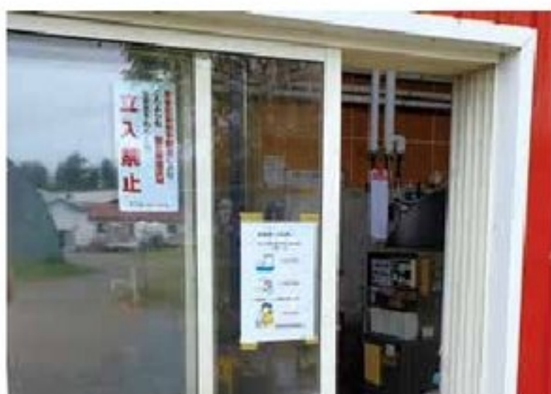
処理室入口に掲示された入退場者への消毒等の注意喚起