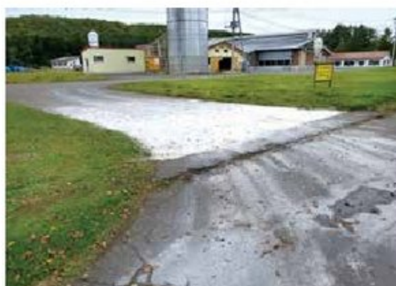
十分な車両消毒石灰帯