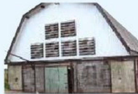
写真③ トンネル換気

キング式牛舎の2階部分のスペースに換気扇を6機設置しています(写真③)。対尻式のつなぎ牛舎ですが、牛舎両側面の窓3ヶ所ずつを半開放し処理室扉を閉鎖することで、牛の鼻面に新鮮な空気を流しています。牛舎の風速を2m/秒確保することで、牛の体感温度をおよそ8度低くすることができました。