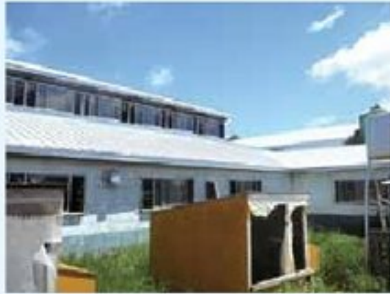
写真① 牛舎屋根の銀塗装

今年も暑い夏がやってきます。暑さをどう凌ぎ、牛を健康に飼うのか、皆さんの取り組み事例を紹介させていただきます。