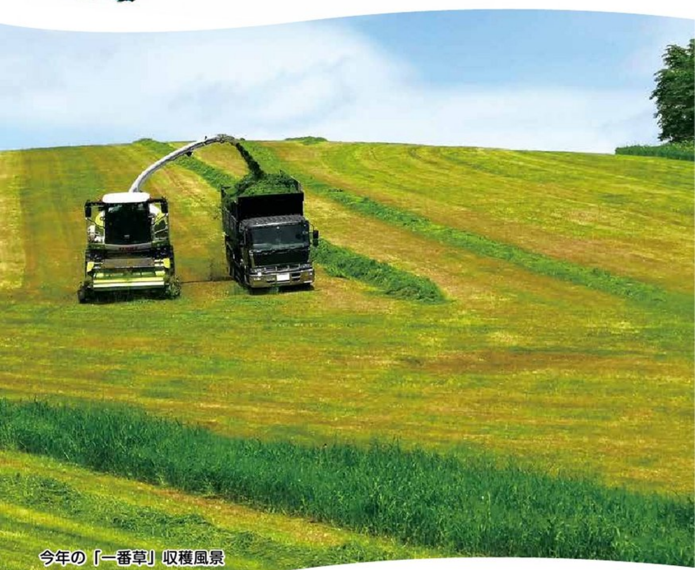
今年の「一番草」収穫風景