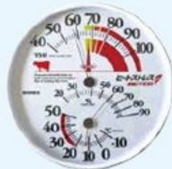
写真④ ヒートレスメーター (EMPEX) THIが人目でわかる！ JA 資材で取り扱っています！

熱ストレスの判断に、「気温と湿度をもちいた「不快指数」があります(表1)。当地域は9月上旬まで不快指数が高い傾向です。ヒートストレスメーター(写真④)で不快指数をチェックし暑さを乗り切る対策をとりましょう。