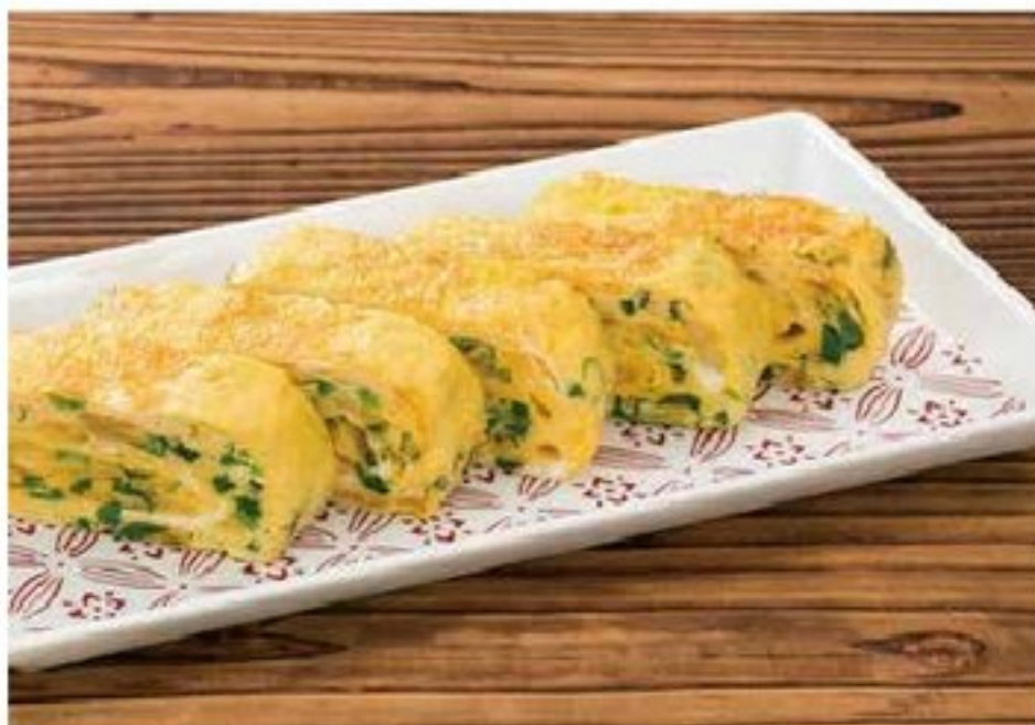
しべちゃ牛乳入り厚焼き卵