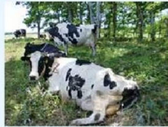
写真② 放牧地の避陰林

■放牧地の避陰林の設置 牧区のレイアウトで、放牧地の複数牧区がある真ん中に避陰林を設置、暑いときに牛が日陰に逃げ込むことができます。