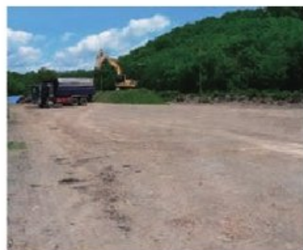
写真2 サイロ周辺が砂で整備された標茶町G農家