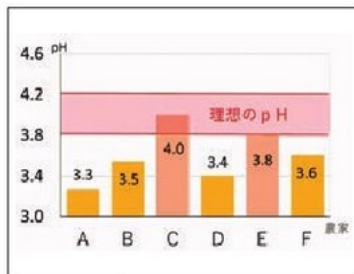
図1 R2年収穫作業時の牧草pH

ギ酸を添加することでpHが下がり、高水分でも酪酸発酵を防ぐことができます。しかし、過剰添加によりpHを下げすぎると、乳酸発酵も止めてしまうため注意が必要です。昨年、普及センターが標茶町で行った調査では、pHが下がりすぎている農家が多いことが分かりま